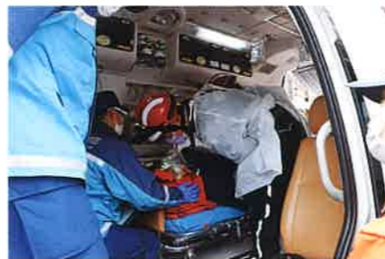
▲ ドクターがすぐに診てくれます。