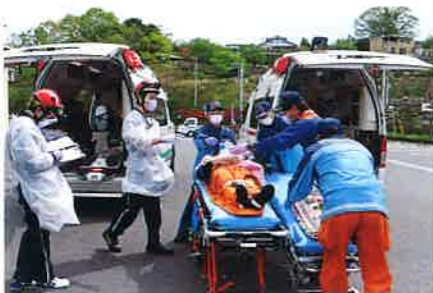
▲ 救急車からドクターカーに傷病者を移している様子。▲

今回導入されたドクターカーは宮崎県が運用しており、休日を除く日中の8:30~17:15まで活動できます。宮崎県北部を管轄しており、医師や看護師が乗り処置します。救急車の要請後に救急隊や指令室でケガや病気をされた方が一刻を争う状態であると判断した場合、消防署からドクターカーを要請します。ドクターヘリと同様に町民の皆さんが直接ドクターカーを呼ぶことはできません。